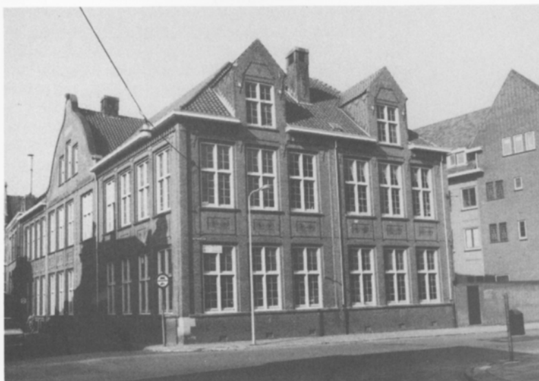
Het voormalige schoolgebouw aan het Gasthuisplein. Gesloopt in 1987.