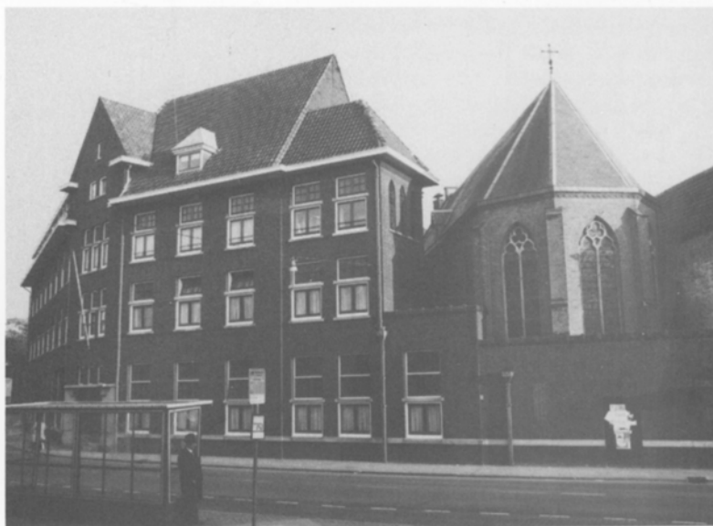
Het voormalige klooster van de zusters van Liefde met de ernaast gelegen kapel. Gesloopt in 1987.

Naast het spitwerk in de grond vond er ook graafwerk in de archieven plaats. De vragen die daarbij gesteld zijn, waren de volgende: Hoe heeft het terrein er in vroegere tijden uitgezien? Wat voor gebouwen stonden er en wie hebben er gewoond.