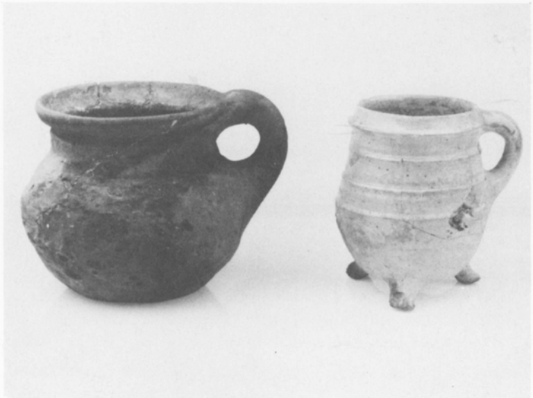
Vondsten uit een ronde waterput die na vervuiling als beerput is gebruikt. Afgebeeld zijn een witbakken kookpot en een pispot. Datering ca. 1400-1450.

Tegenwoordig hoopt men een terrein op door het op te spuiten met zand. Dit gebeurt veel in de nieuwbouwwijken van Zwolle.