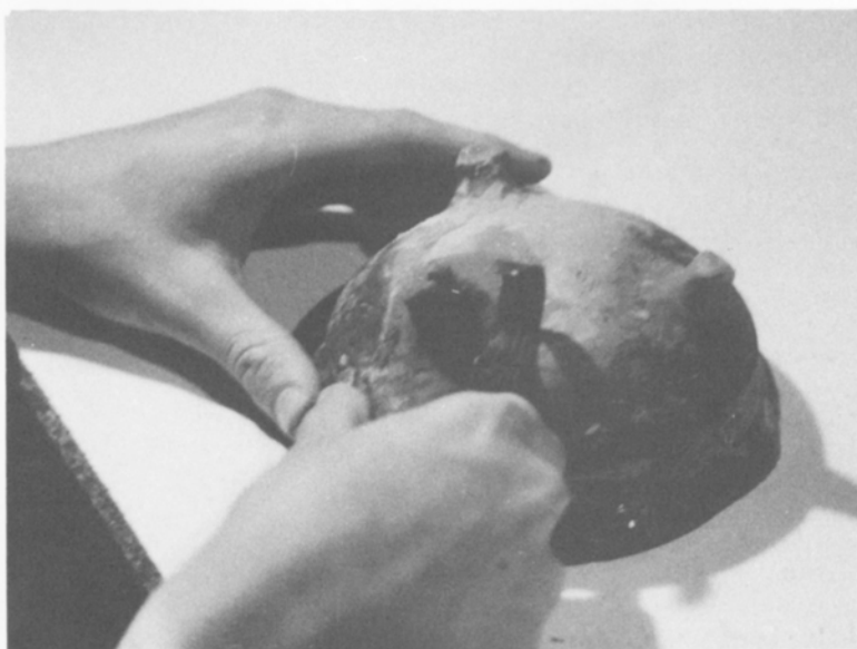
Van een gesteelde kom wordt een gerestaureerd pootje bijgewerkt.

Wat we nu op het Gasthuisplein nog hebben kunnen vinden waren een beerkelder die onder een huis aan de Wolweverstraat lag en een later als beerput gebruikte waterput en een houten afvalton die op de achtererven lagen van gebouwen aan de Vijfhoek.