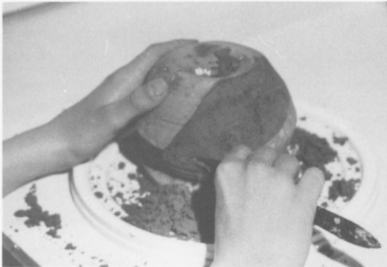
Een pispot mist een groot gedeelte, dat met gips wordt aangevuld.