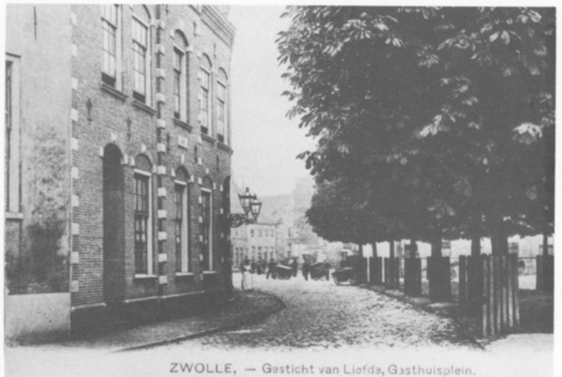
ZWOLLE, — Gesticht van Liefde, Gasthuisplein.

Omdat het grootste gedeelte van het terrein was diepgesloopt kon slechts op enkele plaatsen een profiel gemaakt worden. Het zoeken naar Karolingische sporen (uit de tijd van Karel de Grote) was door de