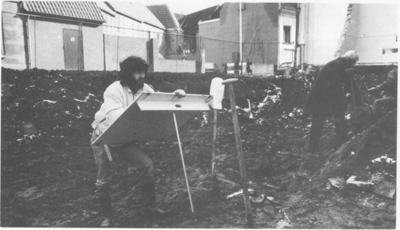
Boven: Archeologen aan het werk op het Gasthuisplein in maart 1987.